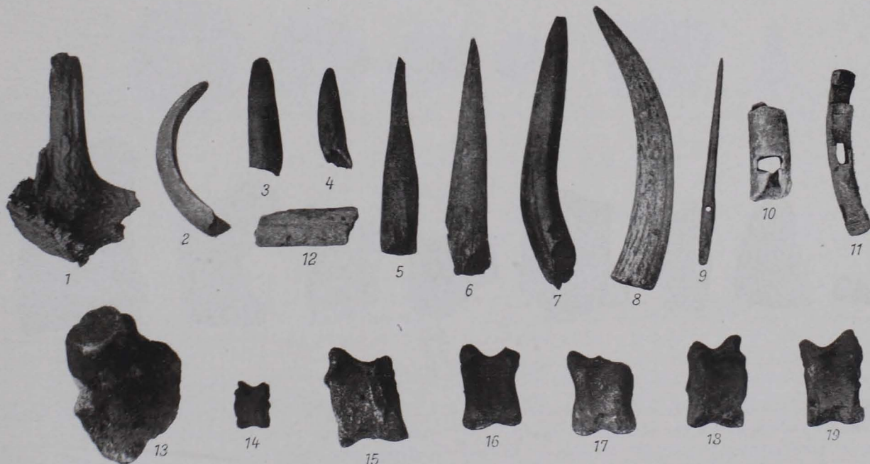
Fig. 16 Gegenstände aus Horn und Bein. \frac{1}{3} n. G.

Fig. 16, 11. Knebel eines Pferdegebisses, aus Hirschhorn, mit drei rechteckigen Löchern. Die gleichsinnigen Achsen der äußeren Bohrungen stehen senkrecht auf der Achse des Mitteloches. Querschnitt der Bohrungen 1·4 × 0·7 cm. Abstand der äußeren Löcher 7·0 cm. Ganze Länge 10·5 cm, Stärke des