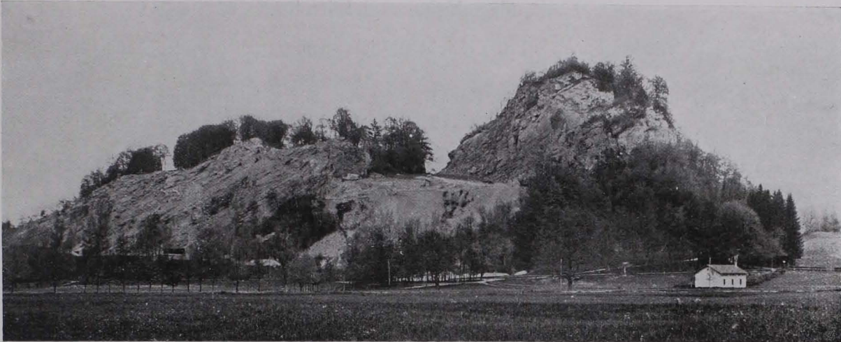
Fig. 3 Der Rainberg von Süden. (Links Niederer, rechts Hoher Rainberg.)