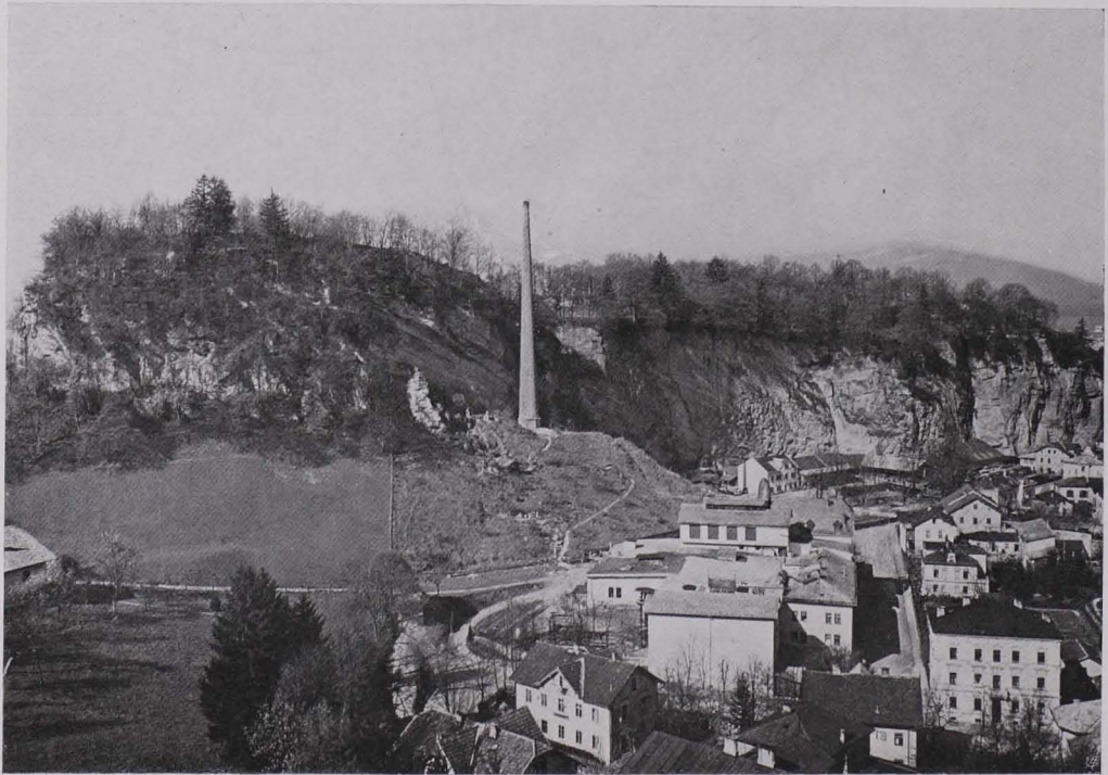
Fig. 2 Der Rainberg von Nordosten. (Links Hoher, rechts Niederer Rainberg.)

So findet sich nahe östlich des Wächterhauses, welches zu Anfang des 18. Jahrhunderts einen Einsiedler 6) beherbergte, auf dem höchstgelegenen Wiesenstreifen des Unteren Rainberges das Planum eines alten Gebäudes, an dessen Nordrande eine verfallene Zisterne liegt. Im Südosten dieser Waldwiese zeigt sich eine künstliche Terrasse als Rest eines Steinbaues.