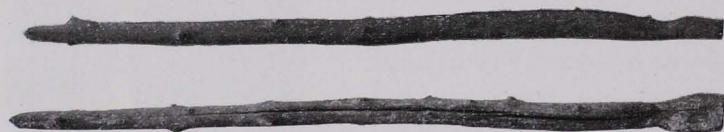
Fig. 17 Tragholz (von der Seite und von oben) [MCA Nr. 1545]. 1/10 n. Gr.

Tragholz (Fig. 17), ein 1·04 m langer Astteil (Tanne), der an dem einen Ende einen Durchmesser von 2·8 cm, an dem andern von 5·5 cm hat. Längs der letzten 11·5 cm des dickeren Endes wird das Tragholz durch flache Abschnitzung der oberen und unteren Seite allmählich dünner, so daß es schließlich in ein vierkantiges Brettchen von 5·5 cm Breite und 2·4 cm Dicke ausgeht. Am Anfange der Abplattung zeigt es