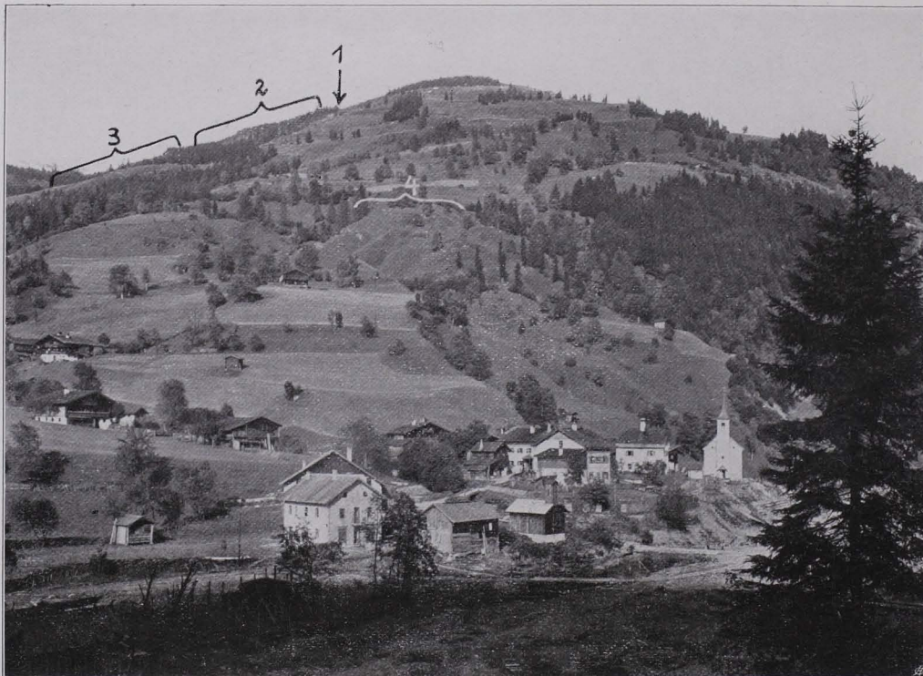
Fig. 41 Südgehänge des Sausteiens. Im Vordergrund der Ort Viehhofen. Bei 1 Schmelzplatz; bei 2 Furchenpingen mit Scheidplätzen (siehe auch Fig. 42, 43, 44); bei 3 Furchenpingen; bei 4 pingennähnliche Gebilde oberhalb des Bachbauerngutes.