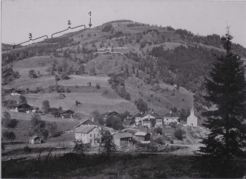
Fig. 41 Südgehänge des Sausteiigens. Im Vordergrund der Ort Viehhofen. Bei 1 Schmelzplatz; bei 2 Furchenpingen mit Scheidplätzen (siehe auch Fig. 42, 43, 44); bei 3 Furchenpingen; bei 4 pingennähnliche Gebilde oberhalb des Bachbauerngutes.