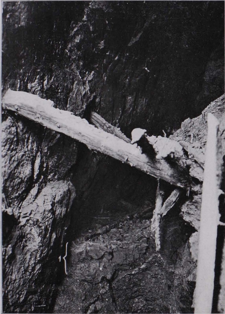
Fig. 39 Fragmente einer „Brückenkonstruktion“ im Verhau III. (Bei Punkt 1 30 cm starke Schlammschichte; s. auch Fig. 38.)