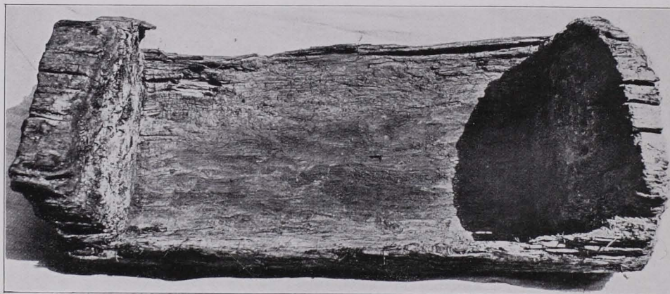
Fig. 35 Wassertrog [1744] aus Verhau II des Hermastollens. \frac{1}{10} n. G.

hinter sich nachzog. Mit ihm mag über glatten Wald- und Wiesenboden Erz zum Scheid- und Schmelzplatze gebracht worden sein. Nach der geringen Abnutzung der Standfläche und dem unversehrten Zustande der Längsränder zu schließen,