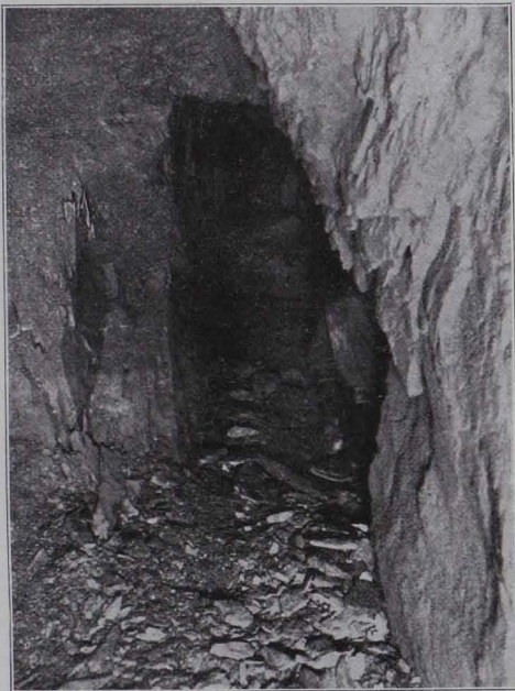
Fig. 15 Verstärkter Verhau, der durch einen südlichen Querschlag des Arthurstollens angefahren wurde.

Folgt man von der Haltestelle Außerfelden der nach St. Johann führenden Straße, so erreicht man nach etwa halbstündiger Wanderung die Salzachbrücke. Läßt man diese links liegen und wendet sich westlich, dem Weiler Einöd zuschreitend, auf das Gehänge des Einöberges, so erreicht man in einer absoluten Höhe von rund 700 m das untere Ende einer mehr als 2 km langen, von Südosten nach Nordwesten im Sinne der Gehängeschraffen streichenden Pinge, die von längeren oder kürzeren, durchschnittlich 5 m breiten und wechselnden,