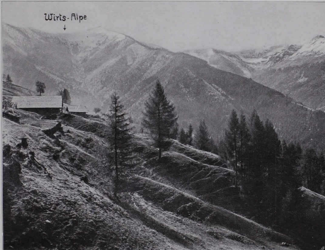
Fig. 43 Furchenpingen, unterhalb der Wirtsalpe am Sausteigen (Detail von Fig. 42).

Von den Steinfunden dieser Lokalität kamen mehrere in das MCA, deren Beschreibung mir O. KLOSE in liebenswürdiger Weise zur Verfügung stellte: