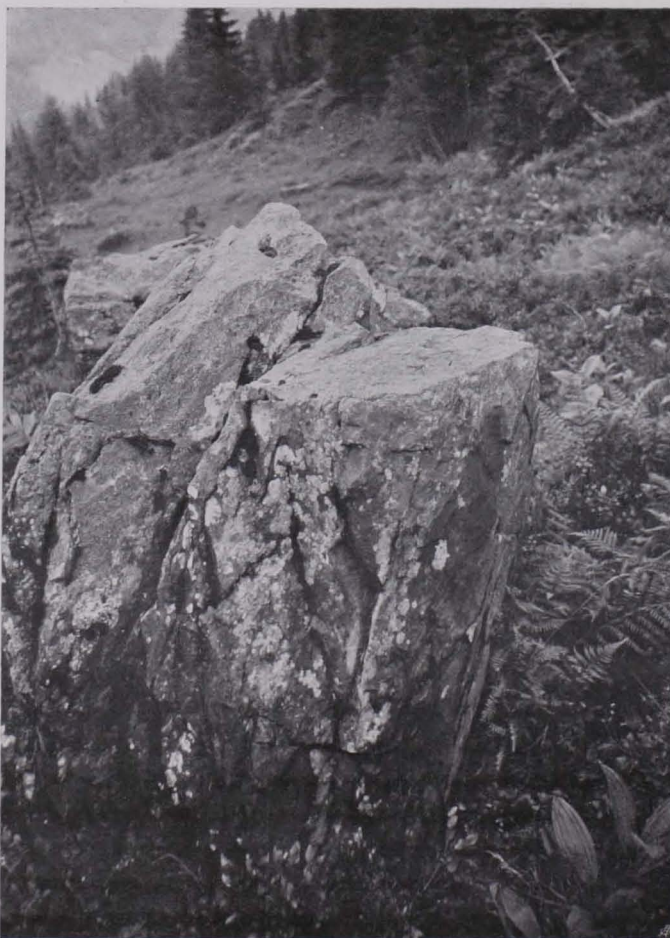
Fig. 13 Felsblock mit Inschrift am Wege im Gainfeldtale.

In Mitterberg handelt es sich, wie bereits aus dem früher Gesagten entnommen werden kann, um den Abbau eines Ganges. Seine Mächtigkeit beträgt durchschnittlich 1·50 m . Auf ihm läuft ober Tag der große Pingenzug (Fig. 1). Es ist höchstwahrscheinlich, daß der Abbau im Osten begonnen und gegen Westen fortgesetzt wurde. Hierfür sprechen mehrere Gründe: