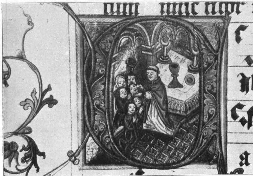
Fig. 557 Michaelbeuern, Antiphonale, f. 130', Kommunion (S. 549)