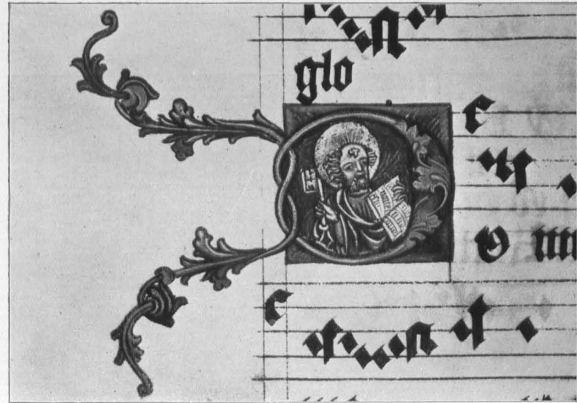
Fig. 556 Michaelbeuern, Antiphonale, f. 128', St. Petrus (S. 549)