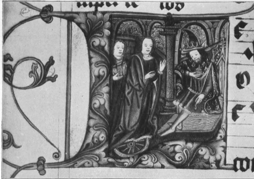
Fig. 555 Michaelbeuern, Antiphonale, f. 128, St. Katharina und der Kaiser Maxentius (S. 549)