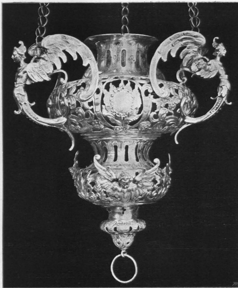
Fig. 506 Michaelbeuern, Silberampel, Augsburger Arbeit, 1658 (S. 515)