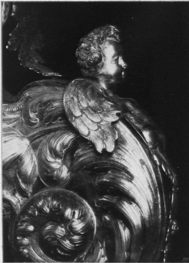
Fig. 498 Michaelbeuern, Detail vom Postament des Silberkruzifixes, um 1650 (S. 511)

3. 117 cm hoch. Vierseitiges Postament aus schwarzem Holze, auf vier versilberten Löwenfüßen, vorne versilberte klassizistische Dekoration (Rad mit Lorbeergirlande mit flatternder Schleife). Oben Totenkopf und -beine aus Elfenbein. Um den Fuß des Kreuzes Schlange mit dem Apfel, Blei, versilbert. Hohes glattes Kreuz aus schwarzem Holze. Kruzifixus aus Elfenbein (33 cm hoch), gut gearbeitet. Darüber Elfenbeinblatt ( I. N. R. I. ). Gute Arbeit, um 1800.