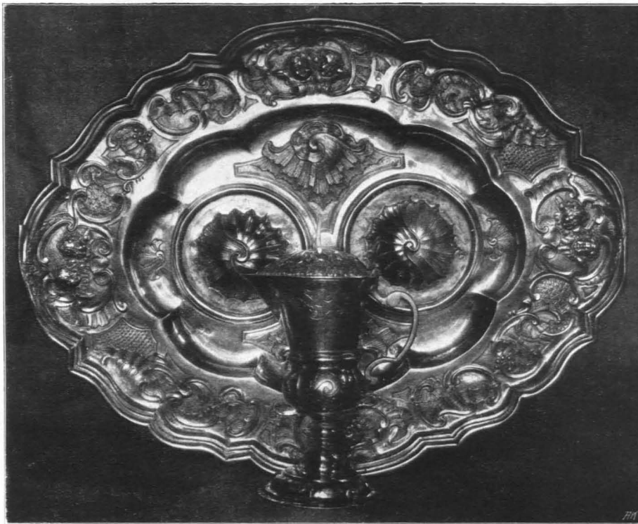
Fig. 490 Michaelbeuern, Opferkännchen und Platte von \frac{IP}{S} in Passau, um 1740 (S. 506)