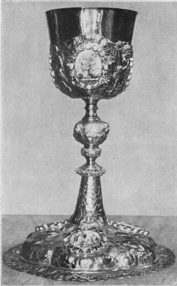
Fig. 486 Michaelbeuern, Kelch Nr. 10, augsburgisch, 1685 (S. 502)