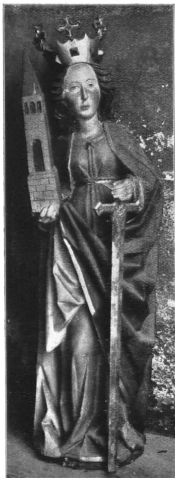
Fig. 404 Dorfbeuern, Pfarrkirche, gotische Holzstatue, St. Barbara, um 1480 (S. 412)