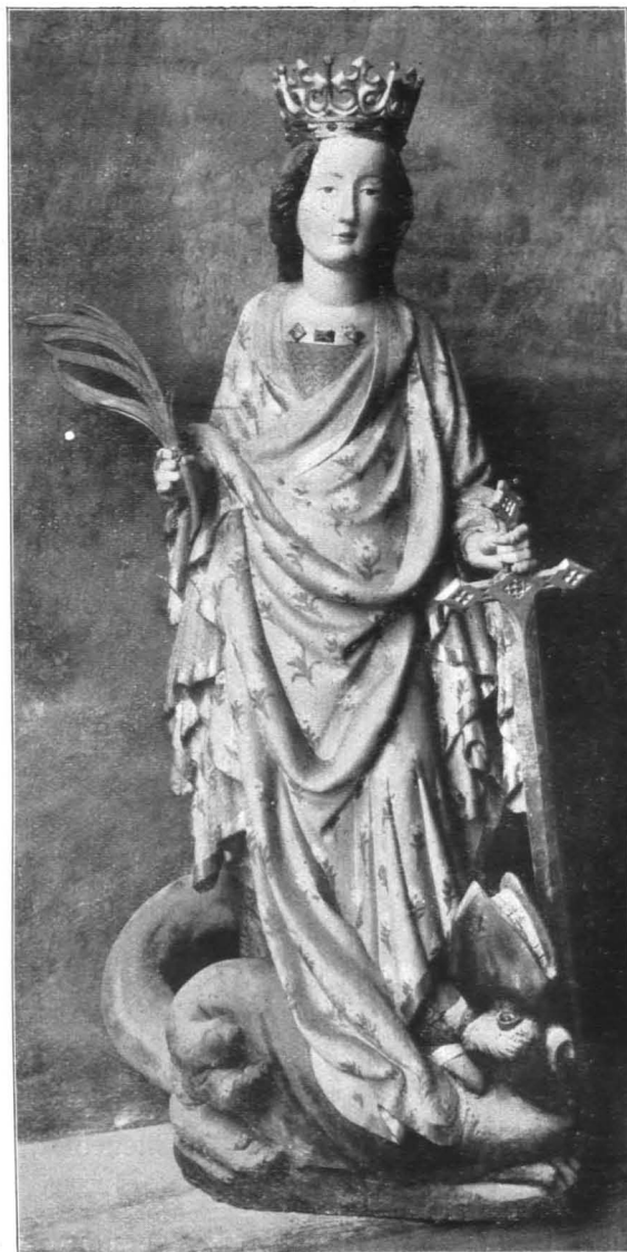
Fig. 403 Dorfbeuern, Pfarrkirche, gotische Holzstatue, St. Margareta, um 1450 (S. 412)