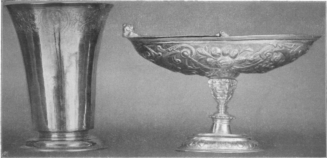
Fig. 379 Arnsdorf, Wallfahrtskirche. a Becher, XVI. Jh. (S. 391); b Schiffchen, Salzburger Arbeit um 1620 (S. 392)

Rauchfaß und Weihrauchschiffchen: Silber. Das Rauchfaß ist verziert mit getriebenen großen Blumen; durchbrochener Deckel mit Blumen. — Marken: Unkenntliches Beschauzeichen (Salzburg?). Meistermarke: MM in rechteckigem Felde. Am Kettendeckel Meisterzeichen L A A . — Das Schiffchen