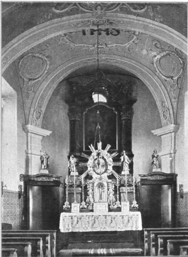
Fig. 332 Obertrum, Pfarrhofkapelle, Inneres (S. 341)