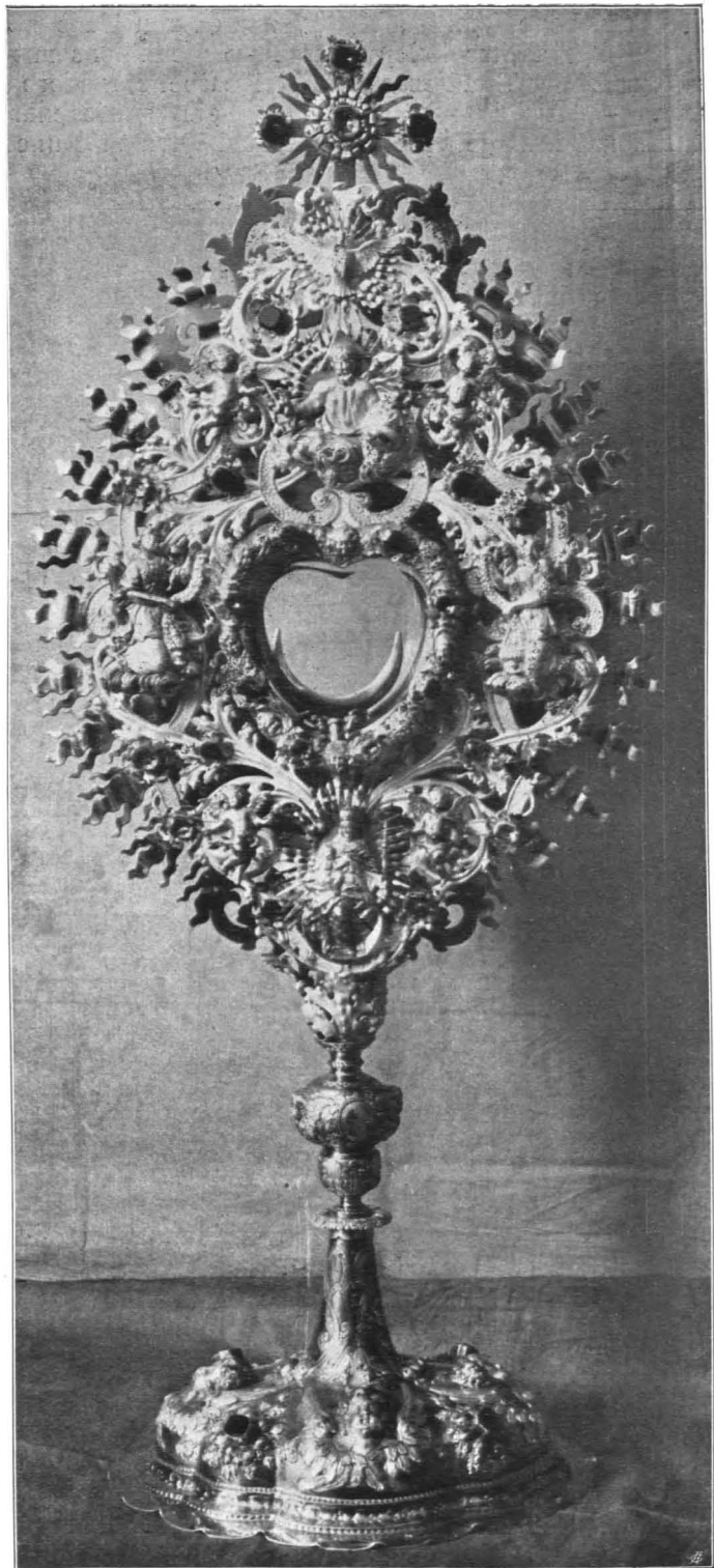
Fig. 281 Mattsee, Stiftskirche, Barockmonstranz von Ludwig Schneider in Augsburg, um 1700 (S. 288)