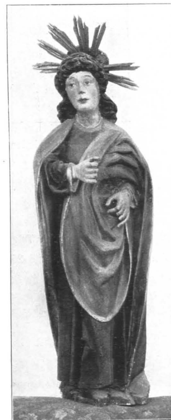
Fig. 230 Hintersee, Pfarrkirche, Johannesstatue, XVI. Jh. (S. 222)