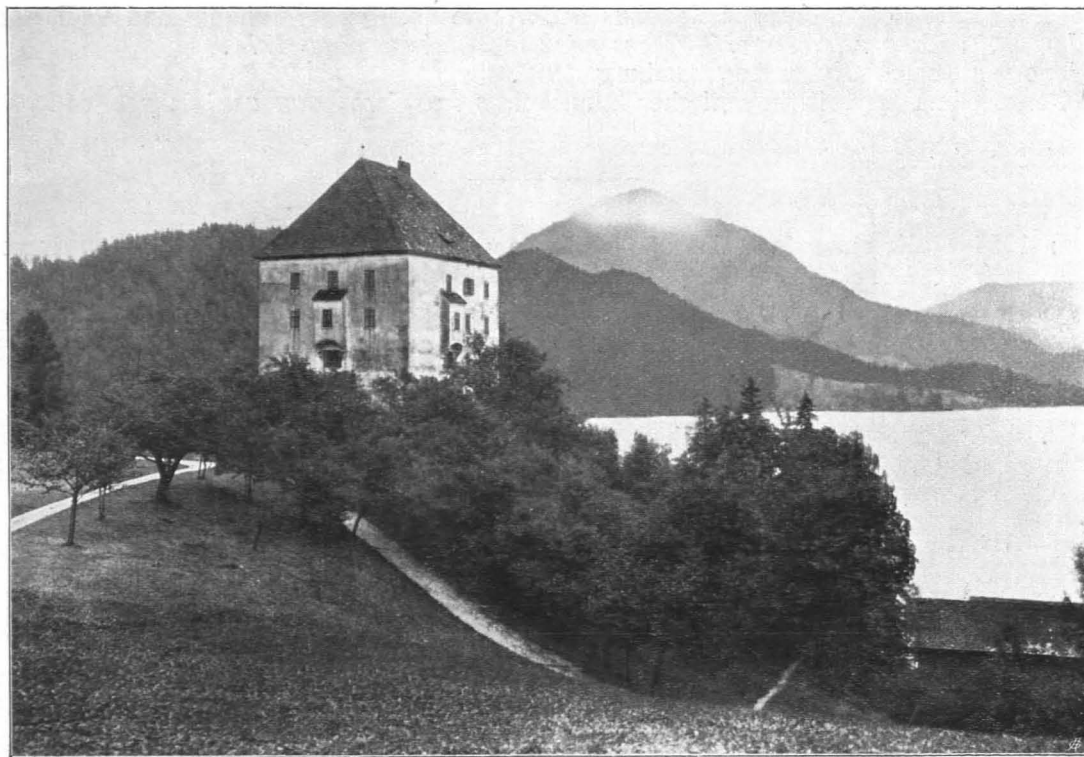
Fig. 215 Schloß Fuschl, Ansicht von Südwesten (S. 214)