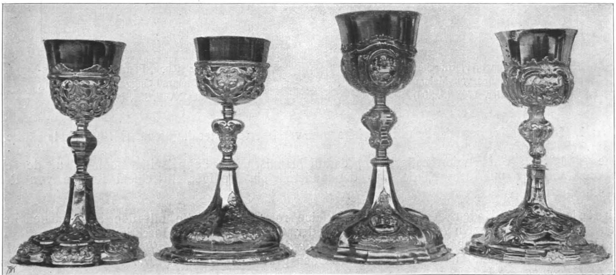
Fig. 212 Faistenau, Pfarrkirche, Kelche. a Salzburger Arbeit um 1714. b Augsburger Arbeit um 1744. c Augsburger Arbeit um 1742. d Um 1770 (S. 210)