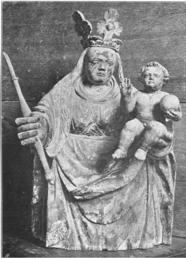
Fig. 195 Zell, Filialkirche, Statue der Madonna mit dem Kinde (S. 193)