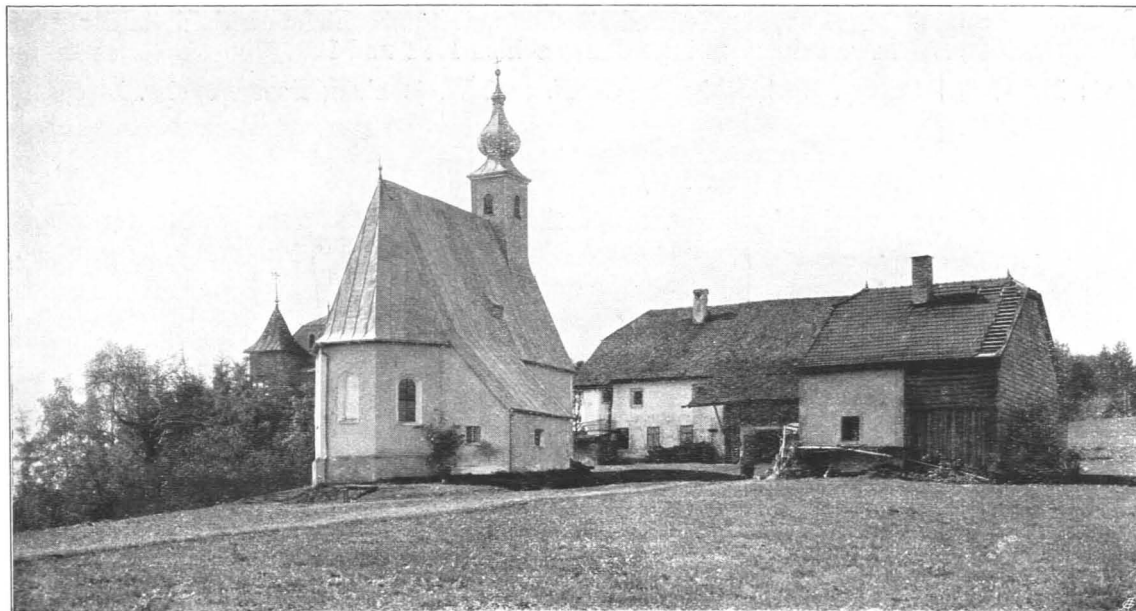
Fig. 191 Zell, Filialkirche, Ansicht von Nordosten (S. 191)

Charakteristik: Einschiffiges gotisches Kirchlein mit flachgedecktem, 1662 mit Kassettendecke versehenem Langhaus, gotischem, netzgewölbtem, in fünf Seiten geschlossenem Chor, Glockentürmchen von 1684 mit barockem Zwiebelturm von 1771. Die Sakristei vom Jahre 1686 (Fig. 191, 192).