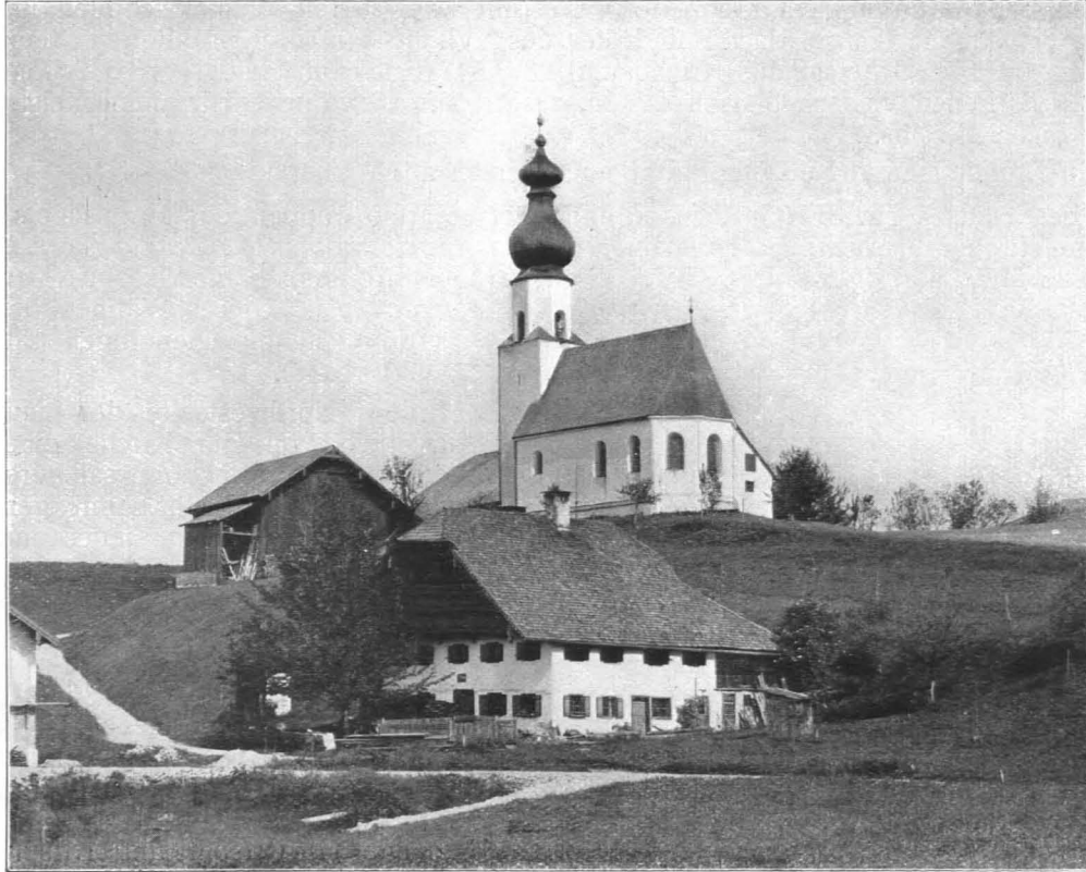
Fig. 180 Waldprechting, Filialkirche, Ansicht von Südosten (S. 184)