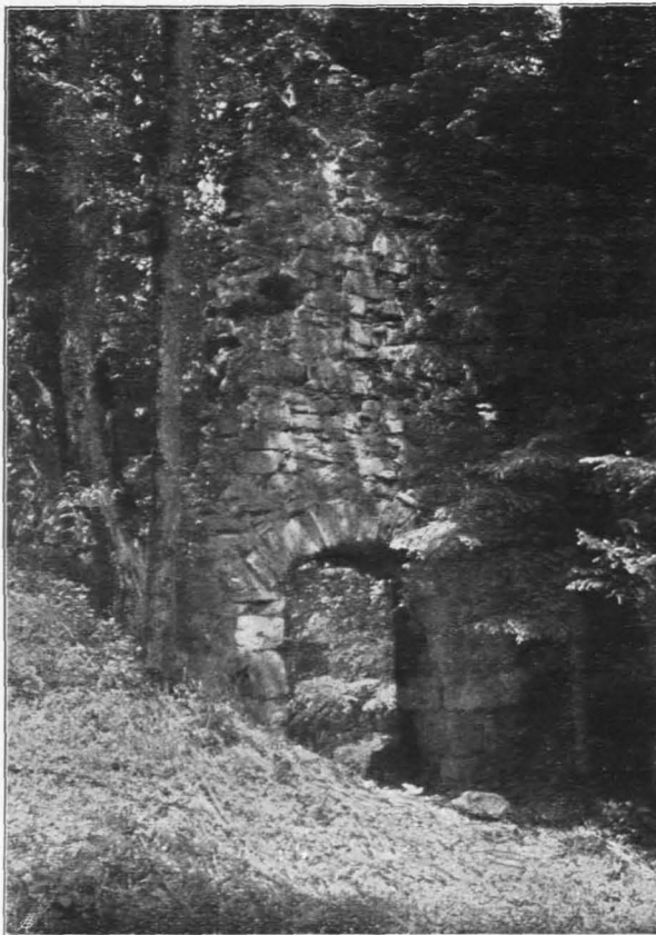
Fig. 95 Liechtentann, Burgruine (S. 102)