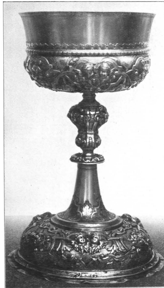
Fig. 85 Köstendorf, Pfarrkirche, Ziborium, Augsburger Arbeit, um 1739 (S. 95)

Gottes, mit dem Leichnam Christi im Schoße, darüber Gott-Vater mit dem Kreuze, daneben zwei kniende Putten. Mittelgut, Anfang des XVIII. Jhs. (um 1728; befand sich über dem jetzt beseitigten Bruderschaftsaltar von 1728).