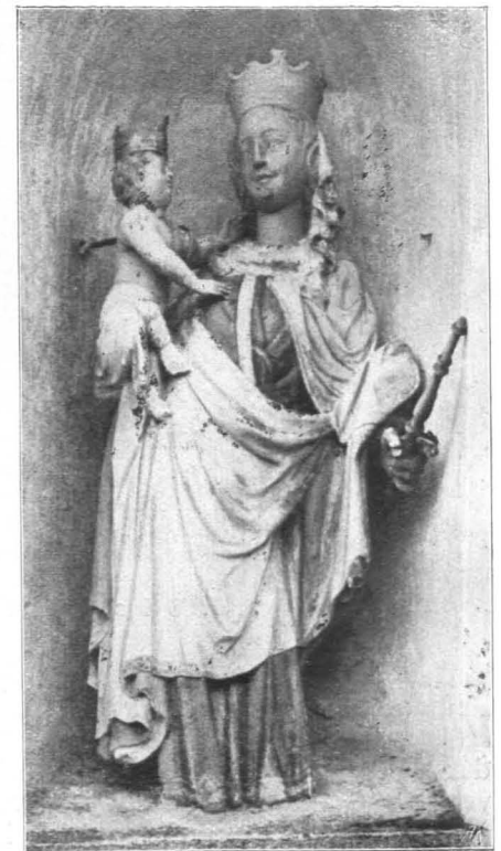
Fig. 60 Irrsdorf, Filialkirche, gotische Madonnenstatue um 1408 (S. 66)

2. An der Außenseite des Chores, im O., in einer Nische. Steinguß, polychromiert. Stehende Madonna mit dem Kinde. Sehr gute gotische Arbeit vom Anfange des XV. Jhs., um 1408 (Fig. 59, 60).