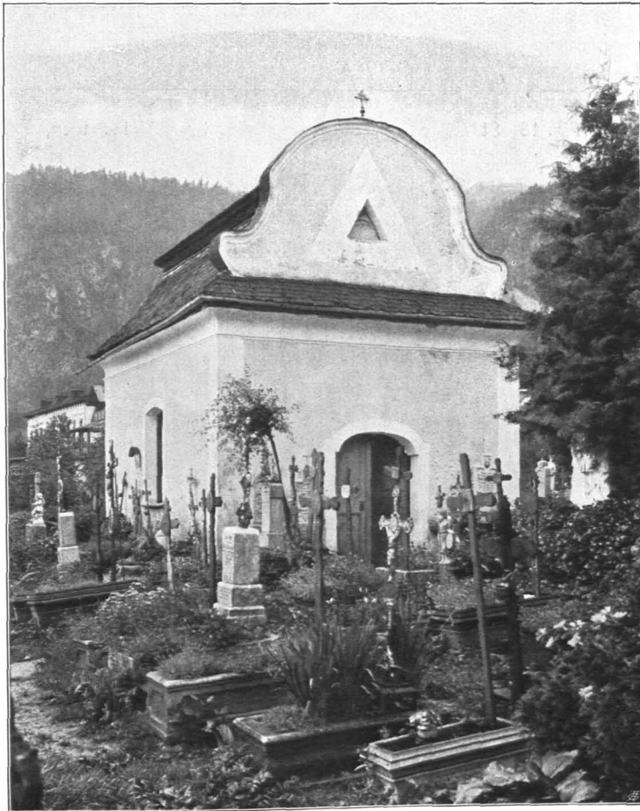
Fig. 17 St. Gilgen, Friedhofskapelle von Norden (S. 19)

An der Decke geringe barocke Malereien. In der Mitte Rosette, in den Ecken vier Bilder in weiß gemalten Rocaillenkartuschen: Sterbeszene, Jüngstes Gericht, Fegefeuer, die Seligen im Himmel. Dazwischen weiße Rocaillen auf gelbem Grunde. Um 1776.