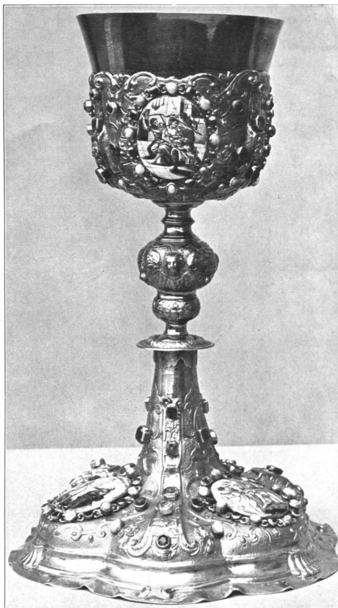
Fig. 457 Lamprechtshausen, Pfarrkirche, Prachtkelch von Ludwig Schneider in Augsburg, um 1720 (S. 470)

hl. Michael über dem Satan. Oben kegelförmiger Baldachin mit unechten Steinen und Kreuz. — Marken: Salzburger Beschauezeichen ( S in ovalem Felde). Meisterzeichen: \begin{matrix} \text{H I} \\ \text{S} \end{matrix} in Dreipaß. Gute Arbeit des Hans Jakob Scheibsradt in Salzburg, um 1680 (Fig. 456).