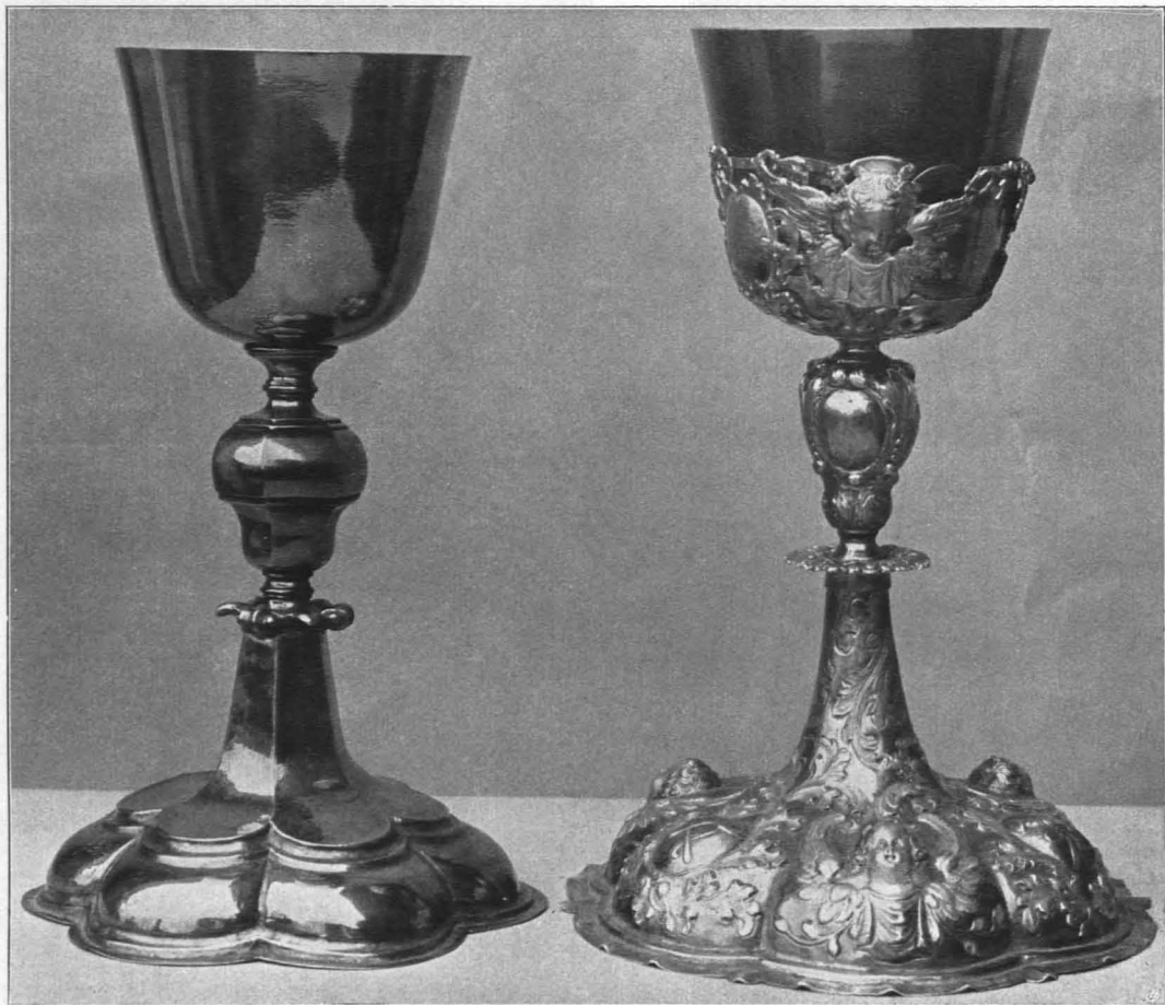
a Fig. 458 Lamprechtshausen, Pfarrkirche, Kelche. b

a Vielleicht von G. Lotter in Augsburg, um 1650. b Von G R, um 1680 (S. 470)