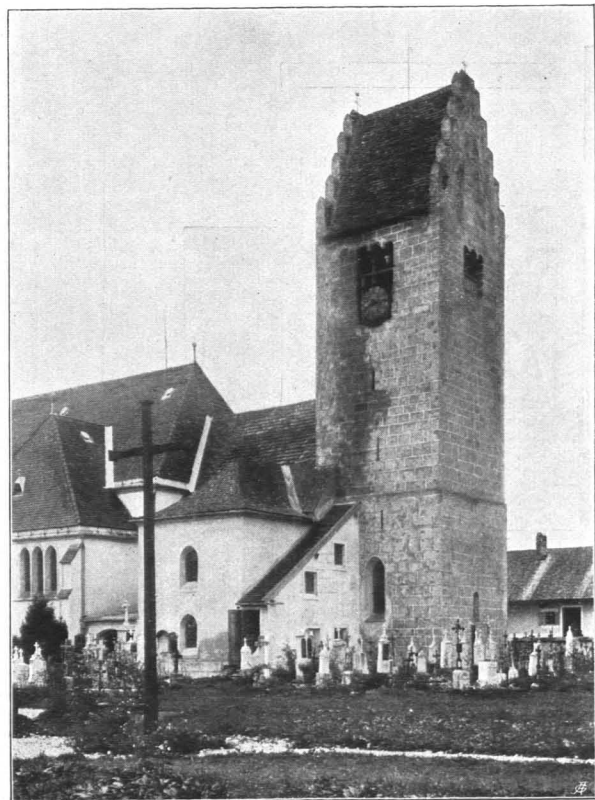
Fig. 454 Lamprechtshausen, Pfarrkirche. Romanischer Kirchturm, Ansicht von Südosten (S. 467)

Turm: Das quadratische Untergeschoß dient als Altarraum. Boden um zwei Stufen erhöht. Kreuzrippengewölbe mit beiderseits gekehlten Rippen, die auf halbkugeligen Konsolen aufsitzen. Im W. Spitzbogenöffnung