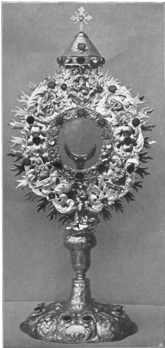
Fig. 456 Lamprechtshausen, Pfarrkirche, Monstranz von H. J. Scheibsradt in Salzburg, um 1680 (S. 469)

gravierte und leicht getriebene Blätter und Früchte sowie das Wappen des Abtes Ämilian von Michaelbeuern (1679—1696) mit den Buchstaben A. E. A. S. M. I. B. — Um das ovale Gehäuse schmalere vergoldete Rahmen mit getriebenen Blattranken, Trauben, Rosen, Äpfeln, Ähren, besetzt mit unechten Steinen. Dahinter vor der breiten vergoldeten Strahlenkranzscheibe durchbrochene und getriebene buschige silberne Blattranken und die getriebenen vergoldeten Halbfiguren Gott-Vaters mit der Taube und der Heiligen Benedikt, Anton von Padua, Felix, Scholastika. Unten die plastische vergoldete Figur des