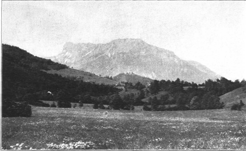
Fig. 198 Der Untersberg, Ansicht von Hinterwinkl bei Ebenau