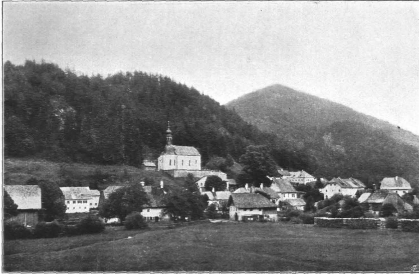
Fig. 199 Ebenau, Gesamtansicht von Westen (S. 201)