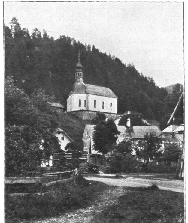
Fig. 200 Ebenau, Pfarrkirche, Ansicht von Westen (S. 201)