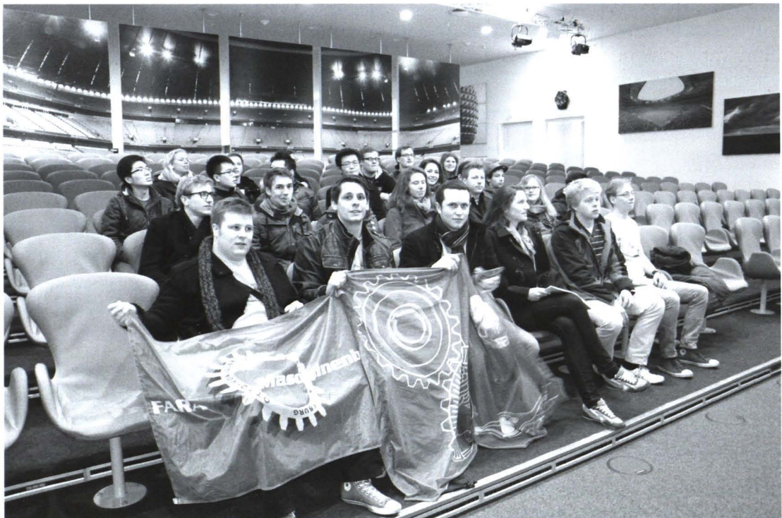
Studierendenvertreter im Presseraum der Allianzarena

Erstmal in München eingeecheckt, durften wir uns