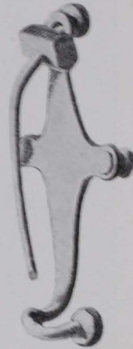
Fig. 69 Zweigliedrige Fibel aus Bronze von Schleedorf, Fp 108 [1307]. \frac{1}{4} n. G. Grab I (nach KLOSE, MB 1904, Taf. I).