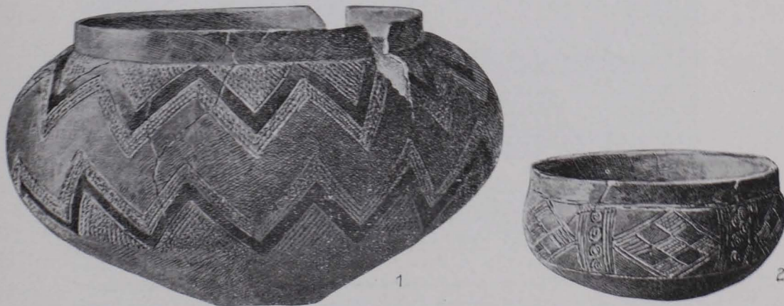
Fig. 68 Gefäße von Schleedorf, Fp 108 (nach KLOSE, MB 1904, Taf. I). \frac{1}{28} n. G. 1 Aus Grab III [1219]. — 2 Aus Grab I [1243].

und von Osten nach Westen bestattet. Da das Terrain in alter Zeit stark sumpfig war, sind sowohl Knochen als auch die Metallgegenstände sehr schlecht erhalten.