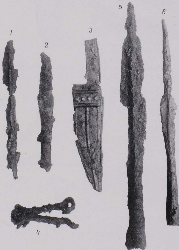
Fig. 53 Funde aus Eisen von Hügelgräbern. \frac{2}{5} n. G.

Grab 5 (Fig. 55) stellt einen Hügel von 0·1 m Höhe und 7·8 m Basisdurchmesser dar. Unter einer Erddecke von 0·1 m zeigt sich ein 0·4 m starkes, sorgfältig geschichtetes Steingewölbe, mit einer Pfeilhöhe von 0·5 m