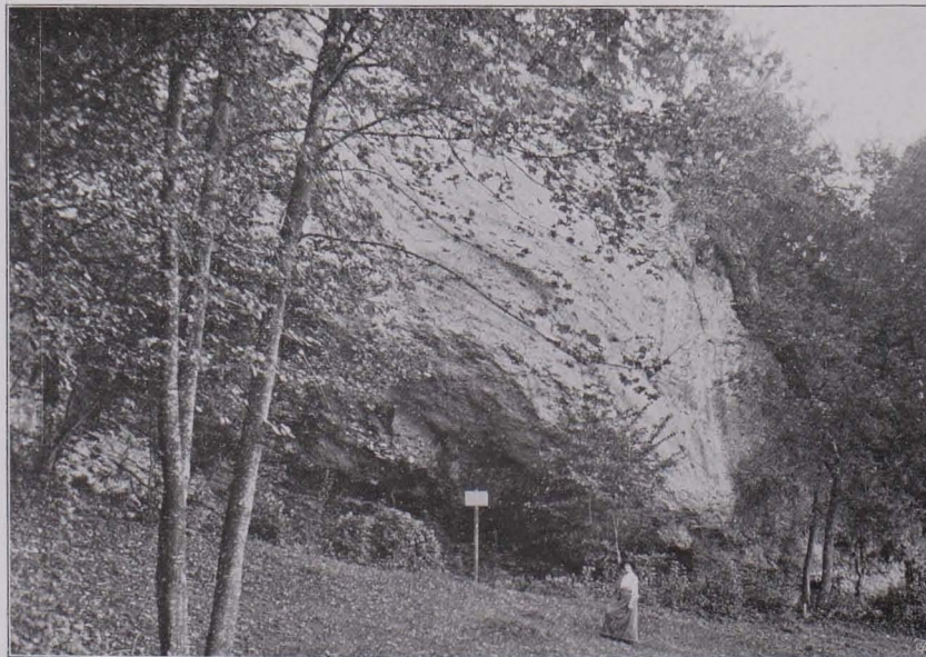
Fig. 41 Eingang zur Höhle von Elsbethen, Fp 26.

Von Siedelungen in Höhlen ist bis jetzt nur eine bekannt, obgleich auch hier bestimmt angenommen werden darf, daß die fortschreitende Erforschung des Landes mehrere Höhlenwohnungen eröffnen wird.