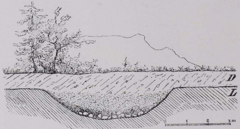
Fig. 40 Profil der Wohngrube bei Puch, Fp 91. (Nach HELL, MWAG, 1913, S. [7].)

Ähnlich verhält es sich auch mit dem Messer (Fig. 39) aus Morzg (Fp 74), auf dessen neolithischen Charakter bereits auf Seite 28 hingewiesen wurde.