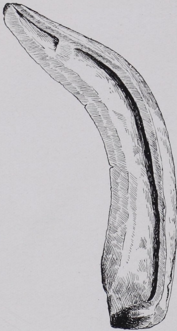
Fig. 32 Sichel aus Bronze vom Georgenberge, Fp 55 [MITTERMAYER]. \frac{2}{3} n. G. (Nach HELL, JfA, 1909, S. 206 a, Fig. 8.)

Die Schichten, wenn man von solchen überhaupt sprechen kann — es wechseln größere und kleinere Blöcke unregelmäßig mit feinerem Materiale — erklären sich zwanglos aus dem periodisch abgelagerten Schwemmaterial und müßten, wenn man sie für in situ liegende Kulturschichten, auf denen Siedelungen katastrophal zugrunde gegangen wären, ansprechen wollte, viel mächtiger sein. Die Funde liegen aber sehr verstreut und keineswegs in kontinuierlichen Schichten.