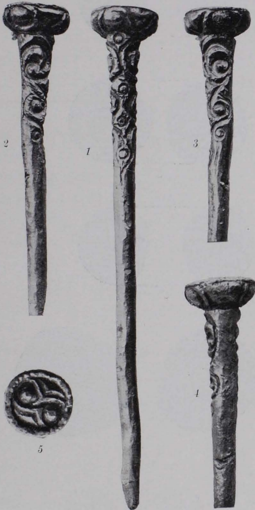
Fig. 9 Halsring, aus Gold, von der Maschalpe, Fp 96 [1255]. \frac{1}{4} n. G. (Nach O. KLOSE, JfA, 1912, S. 2, Fig. 1).

Von Münzen wurden im ganzen 11 Stück gefunden, davon zwei sogenannte Regenbogenschüsselchen (Fig. 11, 8, 10) aus Gold, die übrigen aus Silber. Fig. 11, 1—3 gehören dem Typus der Tetrachmen Philipps II. von Makedonien an; Fig. 11, 4—6 sind von norischem Typus, ein Stück ist eine norische Kleinsilbermünze; Fig. 11, 7, 9 tragen Königsnamen (Gesatorix, Atta).