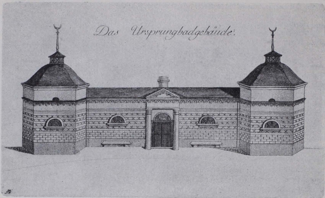
Fig. 243. Baden, Ursprungsgebäude (1909 demoliert) (S. 173).