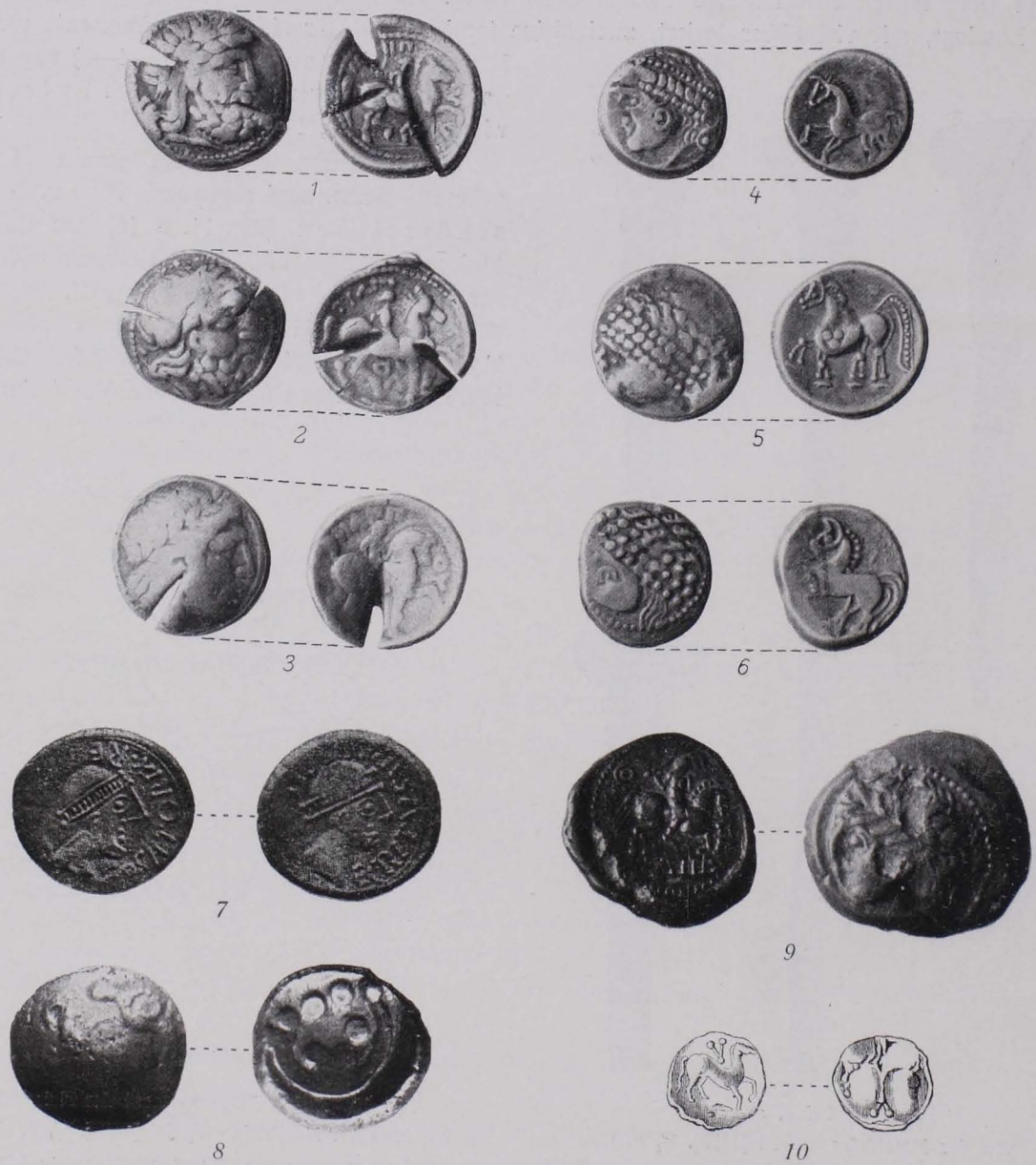
Fig. 11 Münzen. 8, 10 aus Gold, die übrigen aus Silber. 1—7 \frac{1}{1} , 8, 9 \frac{3}{2} , 10 \frac{2}{1} n. G. 1—6 Rauris, Fp 95 [694—699]. — 7 Mallnitzer Tauern, Fp 122 [1260]. — 8, 9 Maxglan, Fp 70 [683, 684]. 10 Dürrnberg, Fp 22 (12) [670].