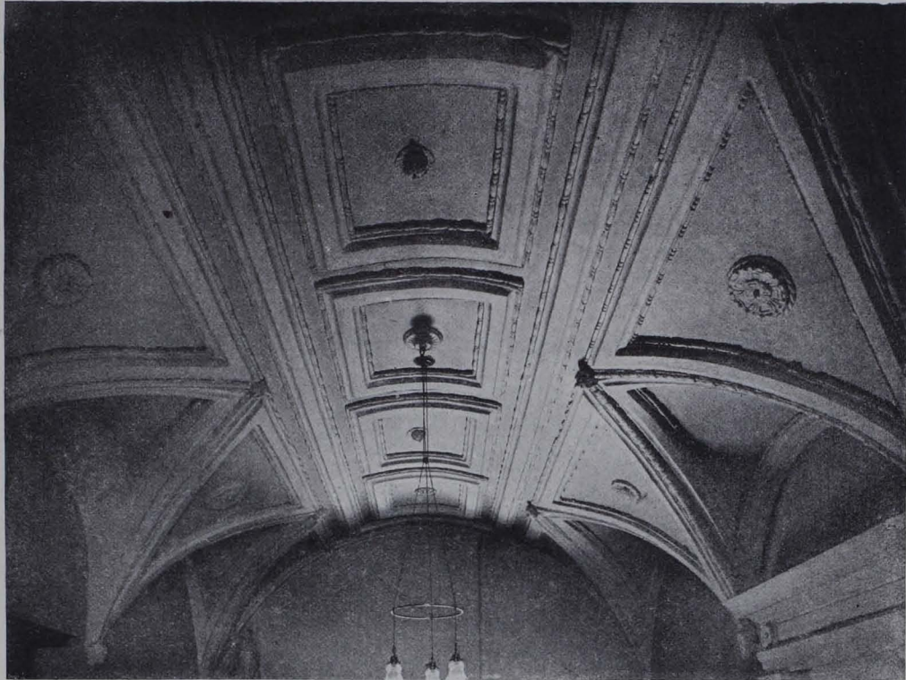
Fig. 169. Schloß Weikersdorf, Gewölbe im Nordwesttrakt (S. 110).