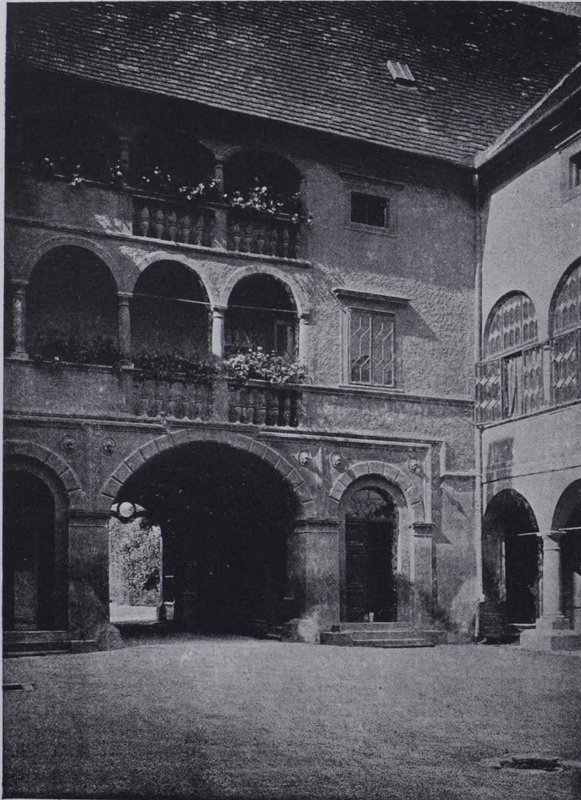
Fig. 156. Schloß Weikersdorf, Schloßhof, Südwestfront (S. 101).