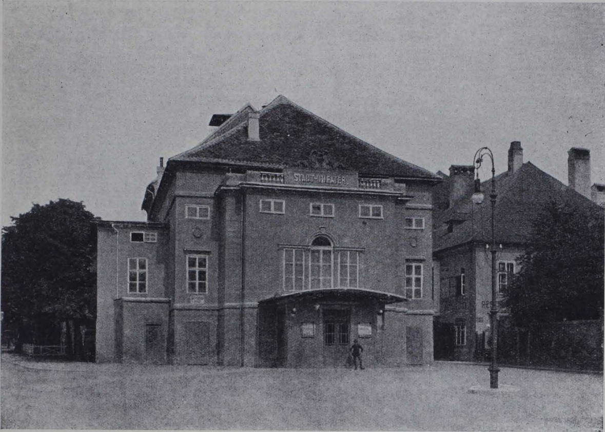
Fig. 91. Baden, Stadttheater von Josef Kornhäusel (1908 demoliert) (S. 60).