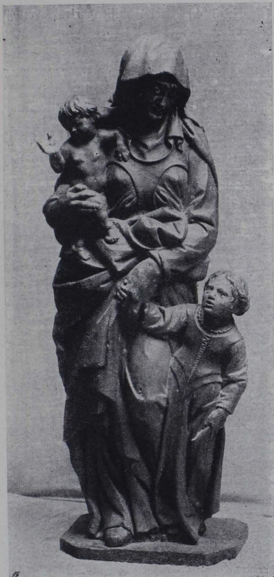
Fig. 87. Baden, Anna Selbdritt. Sammlung Lasser-Zollheim (S. 53).

von Aquarellen und Handzeichnungen von Alt-Wiener Meistern (Künstlerstammbuch der „Grünen Insel“). Literatur: P. TAUSIG, in Österr. Ill. Zeitung, 1909, 21. II., mit 31 Abb.; derzeit nicht mehr im damaligen Umfang erhalten.