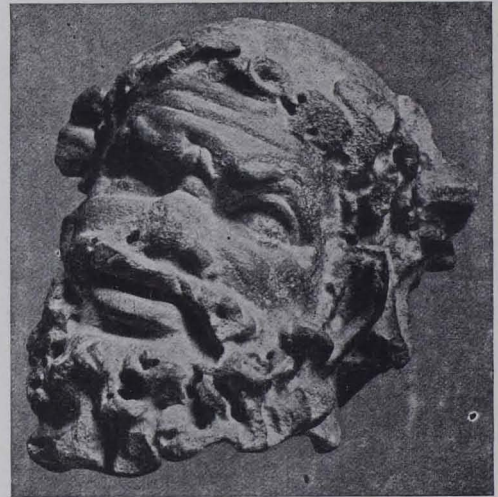
Fig. 86. Baden, Kopf eines Silens. Sammlung Lasser-Zollheim (S. 53).

Frauengasse 1. Bau aus der ersten Hälfte des XVIII. Jhs. mit Stuckplafond, im kreisrunden Mittelfeld Apollo und Daphne, Umrahmung mit