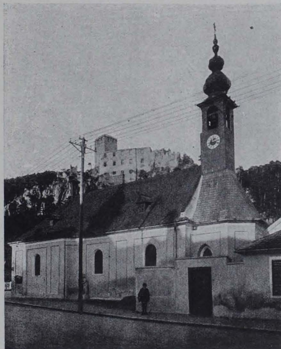
Fig. 69. Baden, Pfarrkirche St. Helena (S. 38).

Seitenaltäre: 1. links. Mensa, Holz, rot und grau marmoriert, mit geschweiftem Profil; Tabernakel tempelförmig, mit toskanischen Säulchen, um 1780. Darüber Tonrelief mit grauer Ölfarbe gestrichen in barocker Umrahmung mit Cherubsköpfen und Putten. Dreifaltigkeitsgruppe von klein gekräuselten Wolkenbändern umgeben. Die drei göttlichen Personen als thronende Könige dargestellt, alle drei von gleichem Gesichtsausdruck mit geteiltem lockigen Vollbart und langem Lockenhaar, das auf die Schultern herabfällt. Gott-Vater mit einer Tiara, in der Rechten das erhobene Schwert, in der Linken den Reichsapfel;