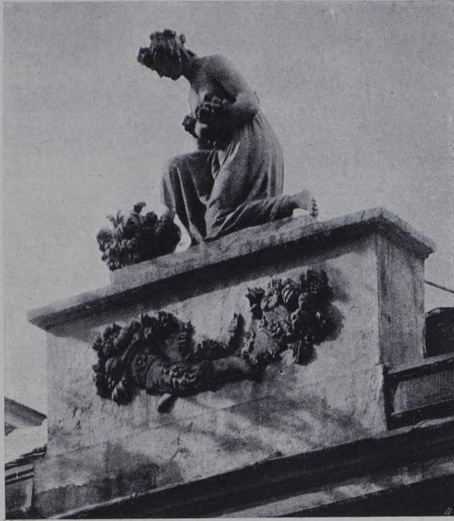
Fig. 66. Baden, Hofgebäude, Flora von Josef Klieber (S. 26).