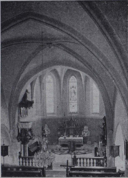
Fig. 33. Alland, Pfarrkirche, Innenansicht (S. 3).

Linker Anbau: Quadratisch mit Kreuzrippengewölbe auf Konsolen; das Rippenprofil gleich dem im Presbyterium; Schlußstein glatte Scheibe.