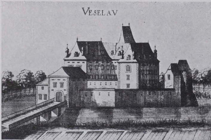
Fig. 317. Schloß Vöslau nach G. M. Vischers Topographie (S. 242).

Fig. 317. Alte Ansichten: 1. VISCHER (1672), p. 112 (Fig. 317). — 2. Kol. Lithogr., gez. v. Wetzelsberg, lith. v. Scheth. — 3. Kol. Radierung v. L. Janscha u. J. Ziegler. — 4. Lithogr., gez. v. Bittner, lith. v. Seybold jun. — 5. Wasserfall im grfl. Friesischen Garten, Radierung v. Joh. Böhm. — 6. Der Wasserfall, kol. Lithogr. — 7. Grotte artificielle au Jardin du Baron de Fries a Vooslau inventée et exécutée par J. F. de Hochenberg architecte de la cour et correspondant de l'Academie Royal de Paris, dessiné et gravé par Charles Schütz. — 8. Grotte im Schloßpark, Ölgemälde von Franz Reinhold 1858 (im Besitz d. H. Moriz Gutmann). — 9. Dieselbe, Ölgemälde v. W. Warteneck (ebenda).