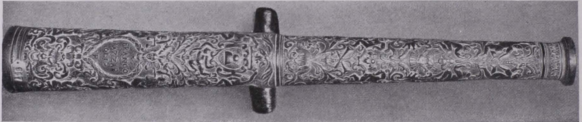
Fig. 407 Modell eines Feldschlangenrohres aus Bronze von Fr. Mazzaroli, um 1670 (S. 312)

10. (867) Modell eines Feldschlangenrohres aus Bronze (Fig. 407). Das ganze Rohr ist mit Grotteskenornamenten bedeckt und zeigt in einem herzförmigen Schildchen ober dem Zündloch die Signatur „FRANCO MAZZAROLI. | .F.“ des um 1670 nachweisbaren venezianischen Geschützgießers. Venezianisch, um 1670.