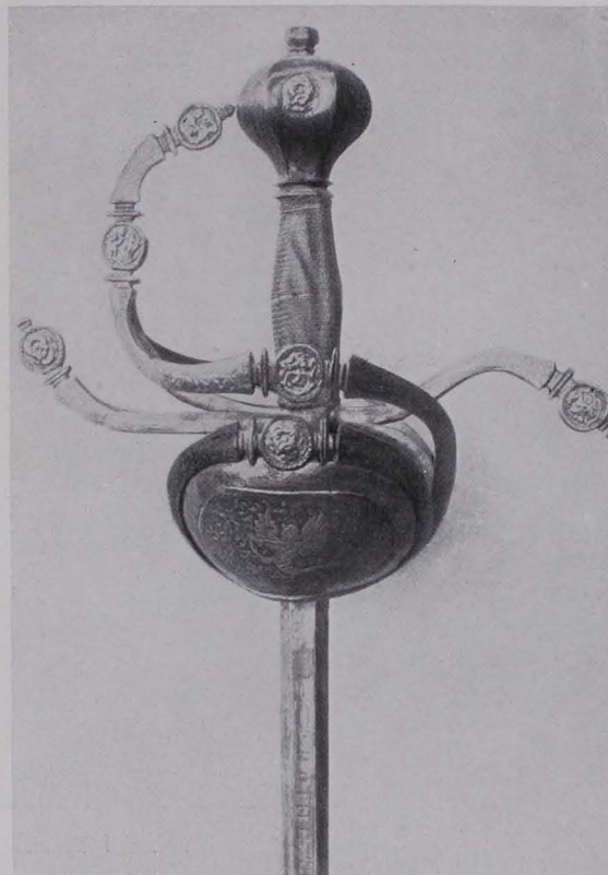
Fig. 399 Prunkdegen, Solingen, Anfang des XVII. Jhs. (S. 305)

35. (297) Degen mit Spangenkorb und der mailändischen Klingensmarke 23. Italienisch (Mailand), Anfang des XVII. Jhs.